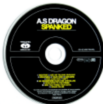
A.S. Dragon. Spanked. CD pour la presse