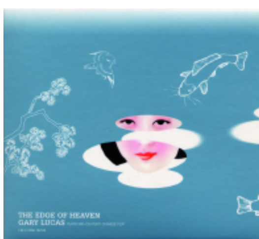
> couverture CD