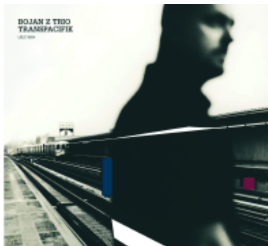
> couverture CD