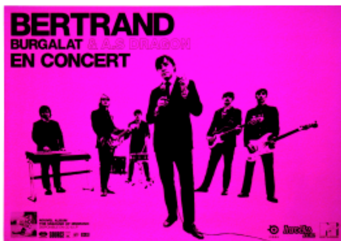
affiche 80 x 120 cm. Impression noir sur papier affiche fluo.